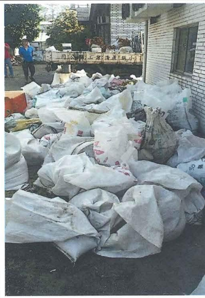
清理前 (溫室鐵門前)