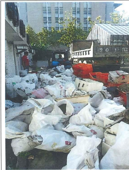
清理前 (圖書館前入口)