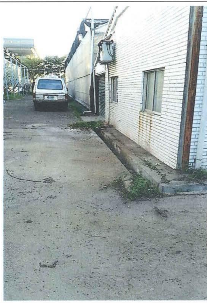
清理後 (溫室鐵門前)